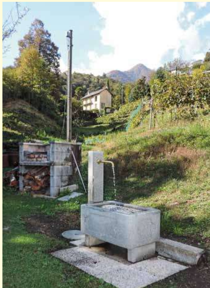
Al parco giochi Beltriga di Contra, che è anche deliziosa zona di svago, il Municipio ha fatto posare dalla squadra comunale una nuova fontana . L'iniziativa è partita dall'Associazione Beltriga

A favore di una riqualifica dell'alveo della Verzasca tra il Ponte dei pomodori e il Pozzone , sarà presto realizzata una “scala di monta” per permettere ai pesci di superare il salto sotto il ponte stesso. L'opera è a carico del Cantone, con una modesta partecipazione dei Comuni.