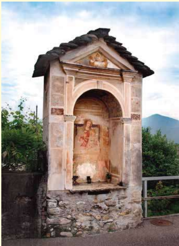
La cappella settecentesca detta “ Patà ” è stata acquistata dal Comune e rimarrà al suo posto al Gerbione. Il mandato per i lavori di restauro è già stato attribuito. L'intervento è previsto per il 2019